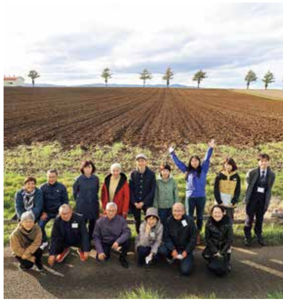
まち巡りツアー（メルヘンの丘）

町長 令和6年度は、定住促進助成金の交付、空き家対策セミナーの開催、東京において移住相談会参加など取り組んだところです。