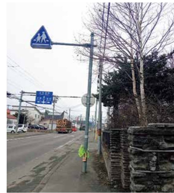
道路敷地、電線等にかかっている樹木