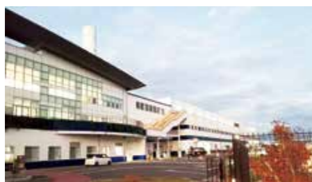
町田市バイオエネルギーセンター

町長 今回の白紙撤回したことに伴い検証委員会が設置され、報告書の中で次の建設候補地の選定に向けた示唆があると思っております。同じ轍を二度と踏まないように1市5町協力をして進めていきたいと思っております。