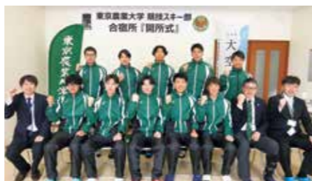
東京農業大学 競技スキー部の学生

町長 人口減少は止めることが出来ないが、下げ幅を緩めていくことが重要だと認識しています。移住定住担当部署も様々なアプローチをしながら、移住者の取り組みを行っています。令和6年度は大空高校の寄宿舎の増築を行い、令和7年4月には旧女満別高校の寄宿舎に新たに東京農業大学網走キャンパスの競技スキー部の学生が入寮します。関係人口を増やし、将来の移住定住に繋がってほしいと考えています。