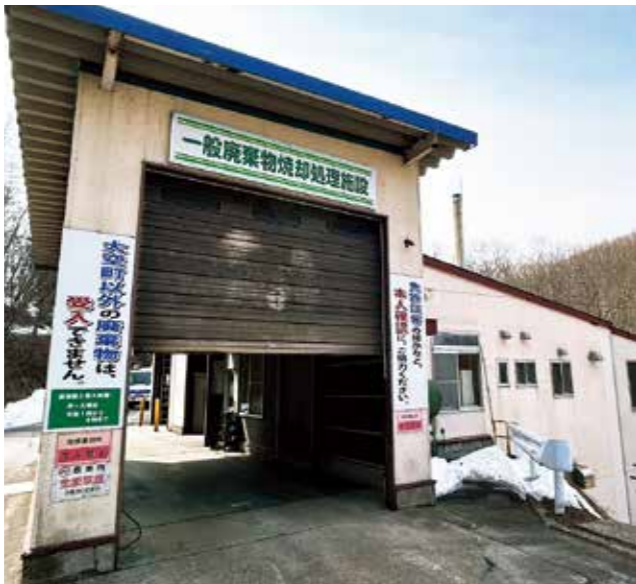
一般廃棄物焼却処理施設

町長 生涯学習の観点からは、住民の主體的な学びを尊重しながら、町長部局と連携し、環境問題に対する意識を高める学習機会の提供に努めます。