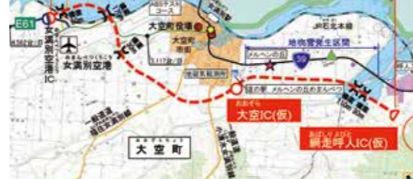
女満別空港網走道路

北海道横断自動車道、女満別空港ICから網走呼人ICの整備計画に伴う排水路の改良、河川の浚渫などを要請するとともに、道路からの排水流下予定の河川である本郷地域の排水路とトマップ川、女満別川の積極的な浚渫事業等の実施をしていただきたい。また、平成27年度に堤防決壊があった女満別川