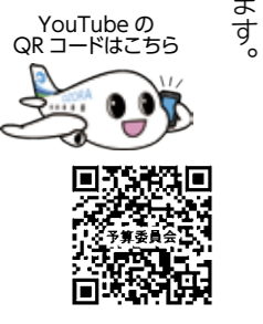
YouTubeのQRコードはこちら

町長 公共施設の統廃合併すれば同じような施設を一つにする考え方はありますが、女満別、東藻琴両地区の距離がある中で、町民皆さんが利用される施設は両方に整備していくことも必要と考えています。施設について、既存の活用できる施設を使い、どうしてもそこでなければならぬものを新たな施設で考えていかなければならない。建築費等の資材費が高騰している中、町の公共施設を維持管理していかなければならぬので、しっかりとスリム化、適正化を行いたいと考えています。