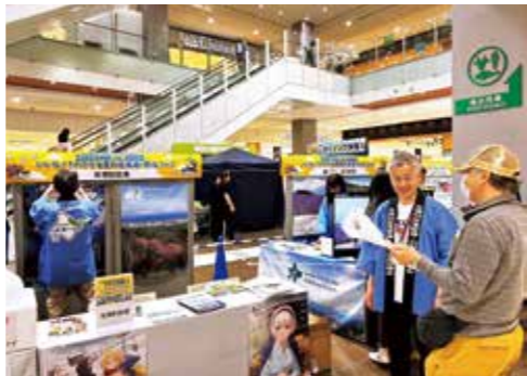
プロモーション活動(名古屋)

の11自治体や経済団体などと協議会を組織し、プロモーション活動やキャンペーン、ツアー造成、地域の魅力をPRする誘客事業などを展開しています。路線の就航地先や航空会社、また、空港運営する北海道エアポートにもご協力をいただくなど、利用拡大と需要創出に努めています。さらに、各航空会社を訪問し、運航期間の延長や増便、新規路線の就航などを要望しています。