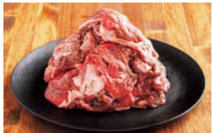
黒毛和牛(芝桜和牛)切り落とし

物価高騰の影響や米の価格の急騰など、社会情勢の影響があり、ふるさと納税全体の傾向として、日用品や日常使いが出来る冷凍保存が可能な食料品である肉、ホタテ、エビ、米など当町では取扱のない返礼品が人気という