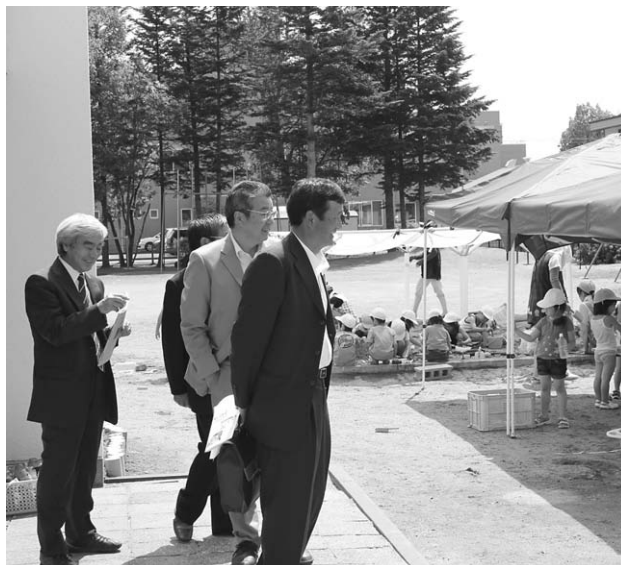
女満別幼稚園視察の様子