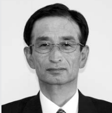
合田前教育委員長

長い間、大空町にとって非常に重要な職務をお勤めいただきました。大変お疲れさまでした。