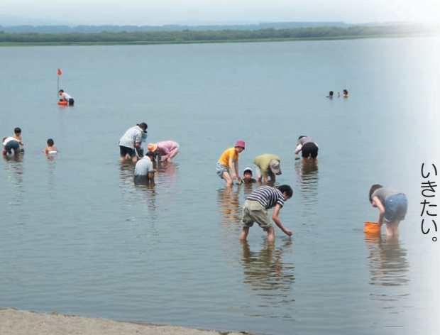
シジミ採りを楽しむみなさん

これまで町は、北海道と何度も道有施設の使用方法を協議してきましたが、今回、女満別湖畔公園運営のために、町が北海道へ使用許可申請を行うことで道有施設を使用することの協議が整ったことから、これまで明文化されていなかった管理方法などを規定した条例を制定し、適正に管理運営していくこととされました。