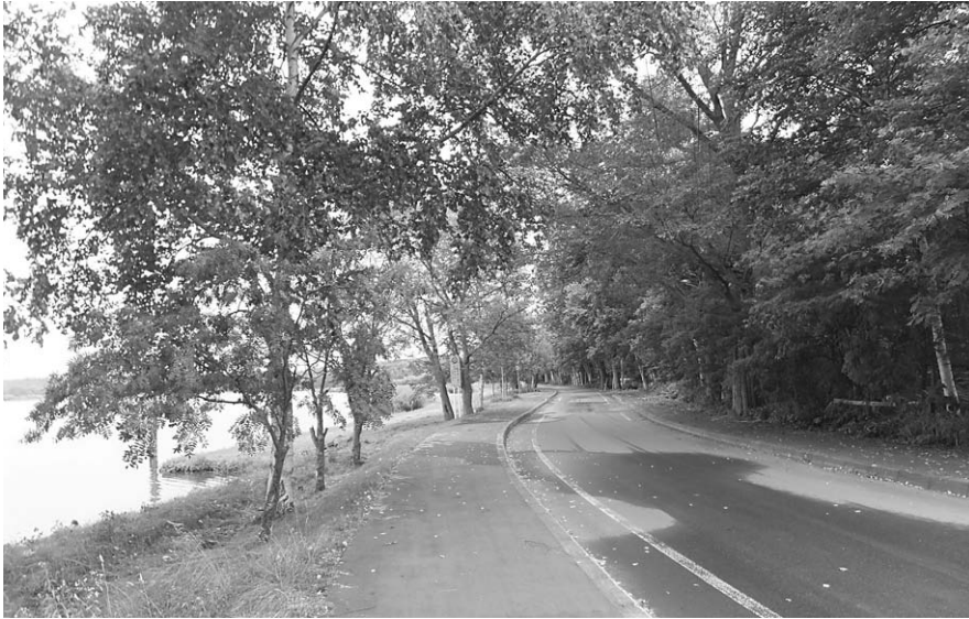
女満別湖畔の風景

樹木などは、できる限り残したいと思っている。今後目くばせしながら対応し、日常の管理をしっかり行う努力をしていきたい。