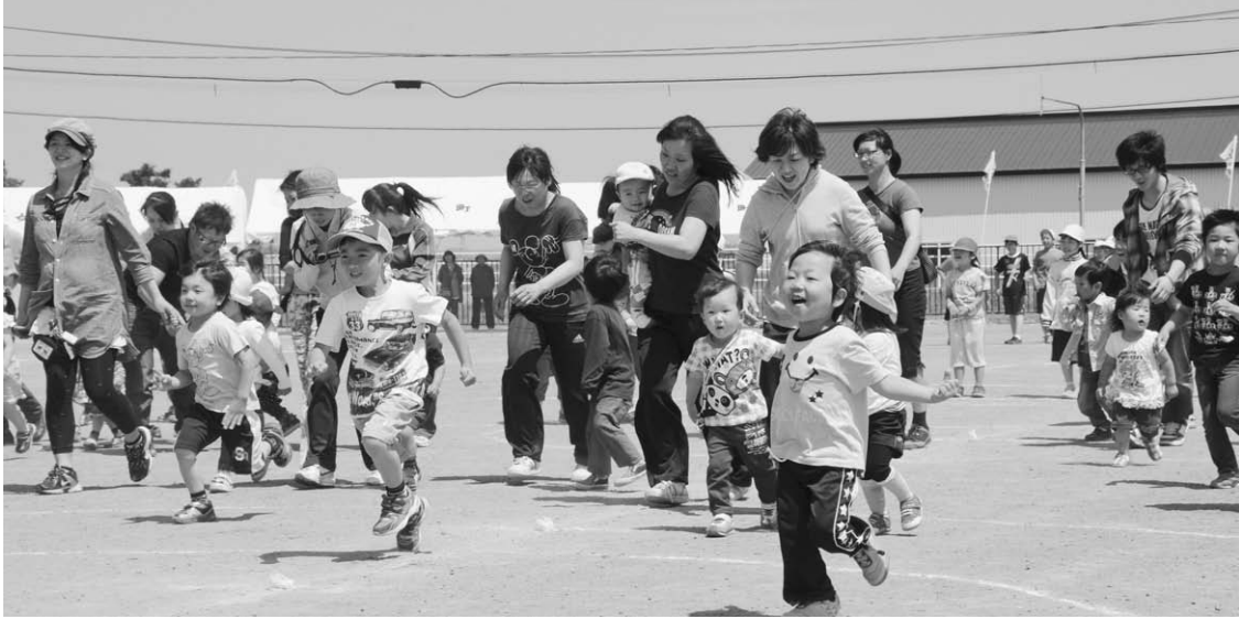
地域ぐるみで行われている豊住合同運動会

議員の私案的意見も含め、プロジェクトの中で十分検証すべき内容だと考える。いろいろな方々から意見を聞く機会をいただきながら、素案づくり、計画づくりを進めていきたい。