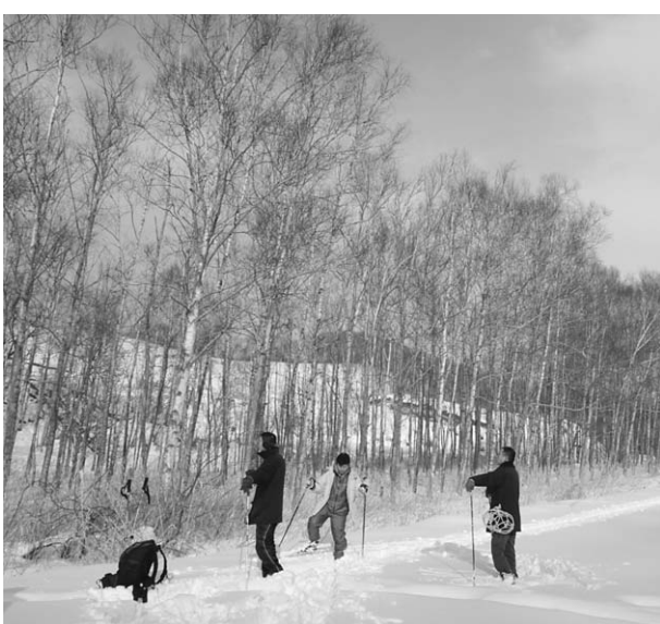
法務省用地 町職員の方たちなどがことしの冬に行った現地確認の様子

対象用地には宝が眠っているのではないかと。大胆に開発するという発想だけでなく、利用していく視点を含め、今回の調査で