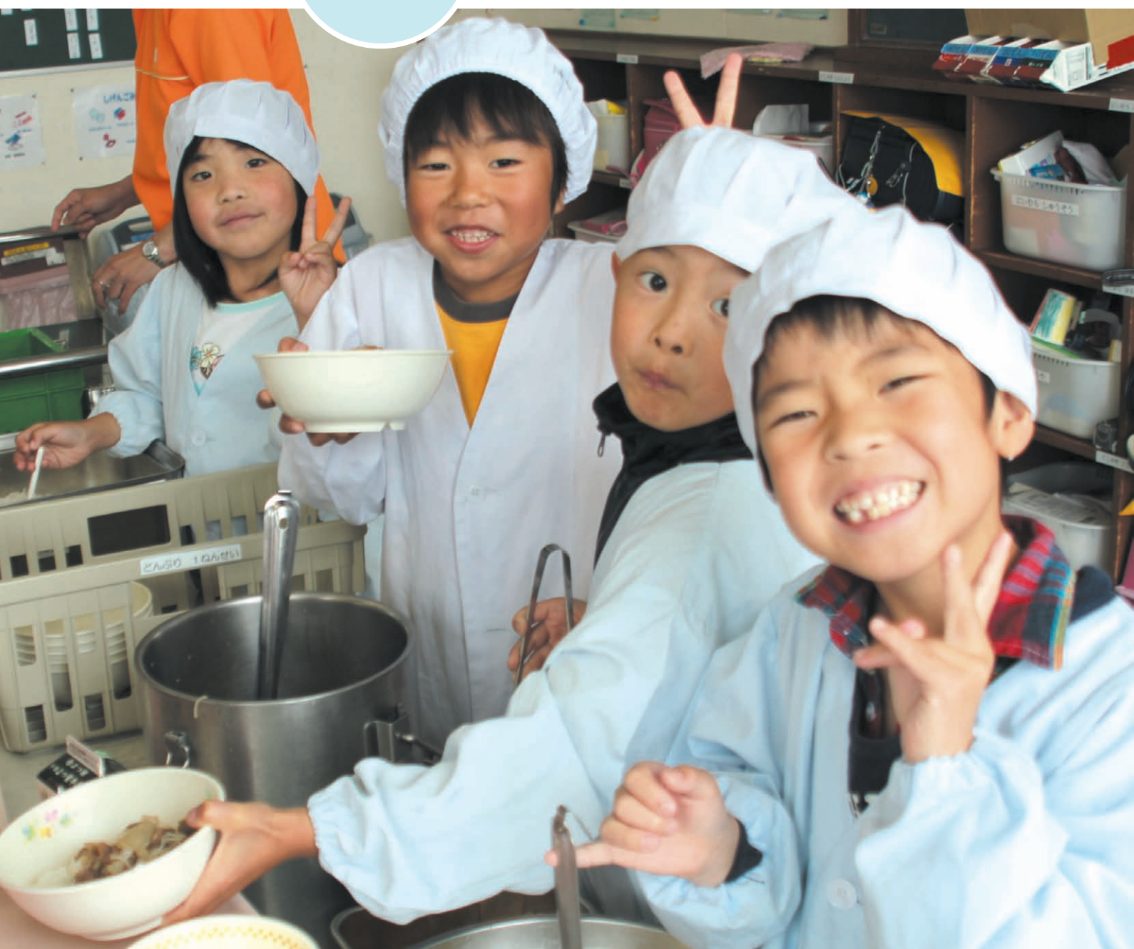
「オホーツクあばしり和牛」を使った牛丼に子供たちは大喜び（東藻琴小学校）