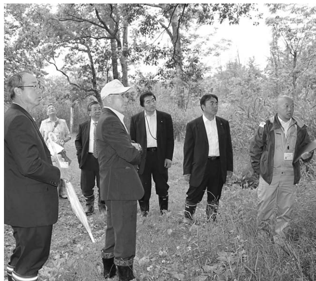
湖畔木道整備に関する現地確認