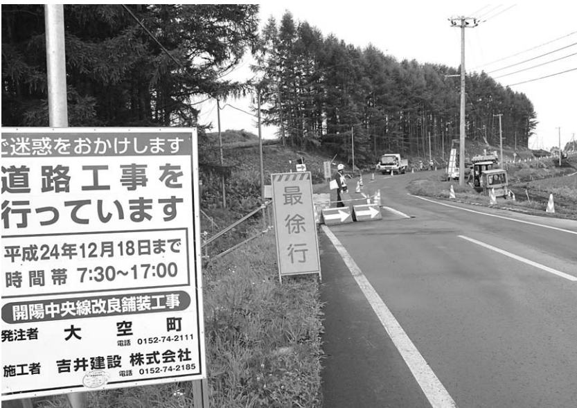
工事が行われている開陽中央線

【朝日西7線】の総延長 廃止区間：1,506.40メートル 認定区間：1,112.55メートル ⇒廃止前の路線から、393.85メートル短くなります。