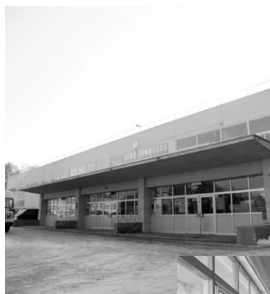
多くの子どもたちが 巣立った旧校舎