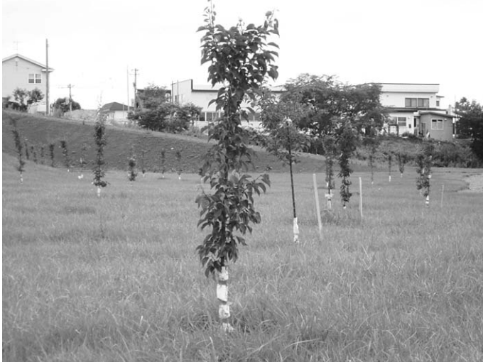
ことしトマップ川近くに植えられた梅の木

ただくことも検討するが、やり方によっては行政側からの押しつけと受けとめられかねない。町民皆さんの機運をどのように盛り上げていけるかということ、は、考えていきたい。