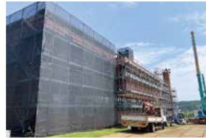
改修中の東藻琴総合支所

開陽中央線改良工事、総合支所耐震補強・改修工事の契約締結について、可決しました。