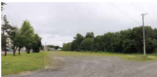
河川防災ステーション建設予定地

町長 平成27年10月、28 年8月に大雨被害 が当町で発生したことか ら、災害時に迅速に対応 できる体制の整備が急務 となり、平成30年3月、 北海道開発局と大空町で 大空地区河川防災ステー ションを整備する計画が 決定されました。 河川防災ステーション は、災害に迅速に対応す る必要があることから、 被害が想定される地域に 設置されます。湖畔周辺 での災害時の拠点施設整