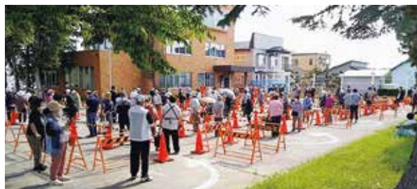
盛況だったプレミアム商品券（第2弾）販売会場