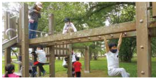
コロナに負けない元気な子ども達

また、勉強の遅れなどを心配して、市販の教材や通信教育などの出費を余儀なくされた家庭もあるのではないかと思います。このように家計の負担が増している子育て世帯に対し、町として何か支援をする必要があるのではないかと思います。