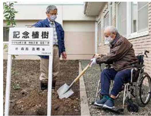
ドリーム苑利用者による記念植樹

その後は町内での感染確認の発表を受け、デイサービス、ショートステイおよび自宅を訪問してサービス