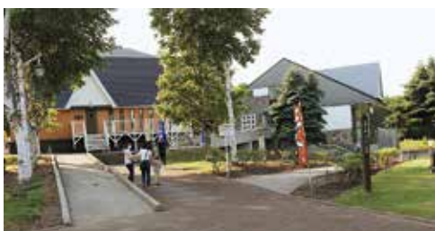
指定管理者施設の「ひがしもこと乳酪館」

現在、一部を除く指定 管理者は、町の関連団体、 第三セクター、法人格を 有する方々で、指定管理