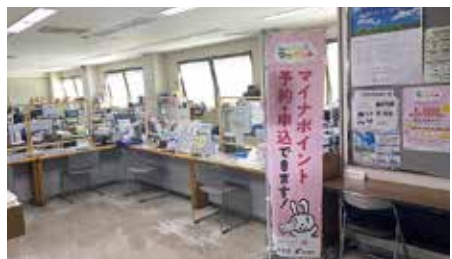
戸籍窓口に設置された手続きスポット

大空町の交付は604枚で、人口に対して8.3%となっております。マイナンバーカードの取得が進んでいない理由として、取得の手間と利便性の低さというものが一般的に言われています。