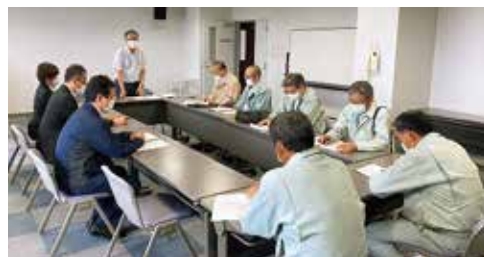
議会による中央病院での感染症対策聞き取り調査

町長 雇止めなどにつ いては現時点で把 握できていません。町で は3月に公共工事の工期 延長や前払金の拡充を行