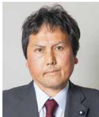
たなかひろゆき 田中裕之 議員

感染防止に向け、毎日子どもたちのために頑張ってくれている先生方に感謝申し上げます。