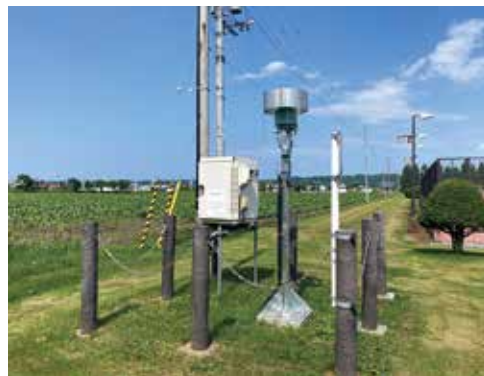
東藻琴市街地のアメダス観測設備

し、農業者の皆さんに気象情報を提供していた時代がありました。これは日本気象協会に委託し、年間200万円程度の保守管理料を支払いながら運営していたものです。老朽化や故障により機器の更新が必要な状況となり、最近ではインターネットや携帯電話などの普及により、さまざまな気象情報サービスが入手できる時代になりました。ことから、費用対効果を含めて農協と協議を行い、町として気象観測所を設置する時代は終えたと判断し、平成29年度をもって女満別地区の4地点、30年度をもって東藻琴地区の2地点の観測を終了しました。