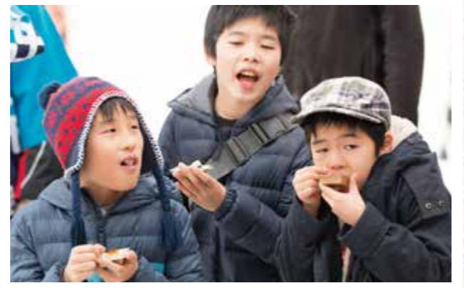
モチモチして最高!