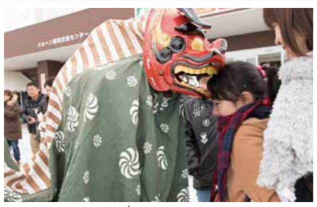
ご利益がありますように