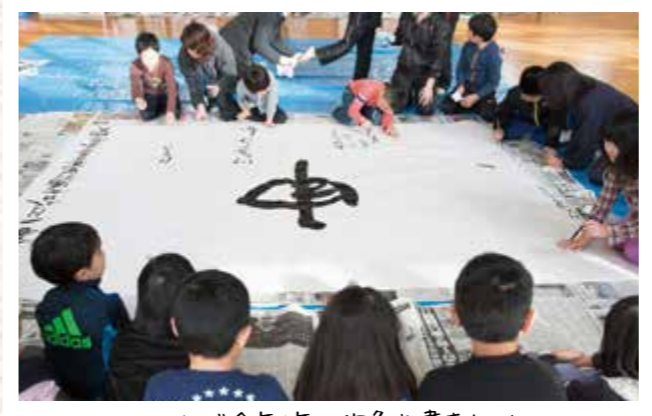
みんなで今年1年の抱負を書きました