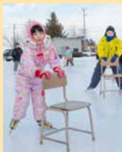
今月の表紙 スケートにチャレンジ!

今年もたくさん子どもたちが参加したスケートチャレンジ教室。楽しそうにスケートをする子どもたちの姿にウィンタースポーツ実行委員会の皆さんも嬉しそうでした。