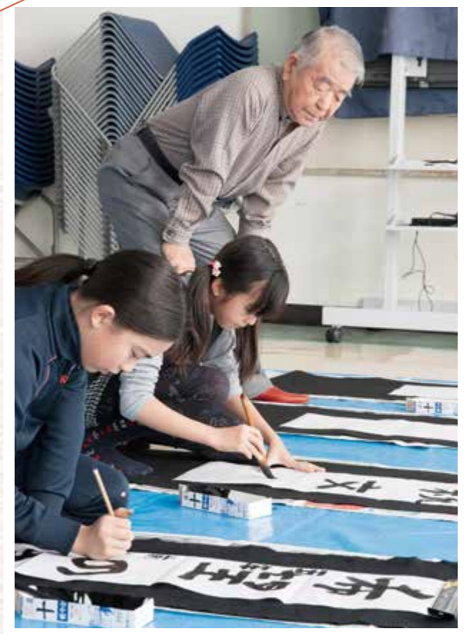
東藻琴 講師が優しく見守ります