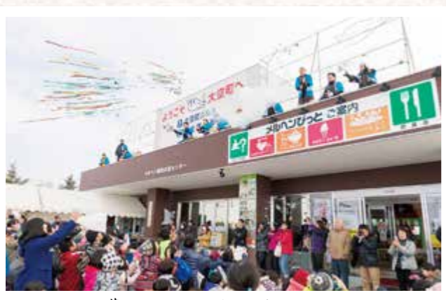
花火の合図でもちまきスタート!