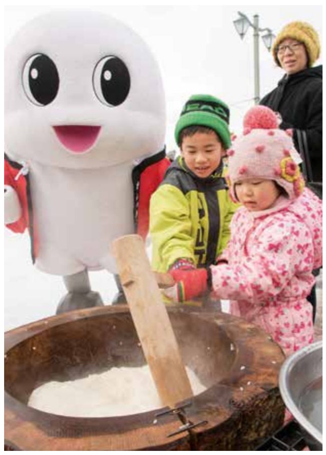
息を合わせて、よいしょ!よいしょ!