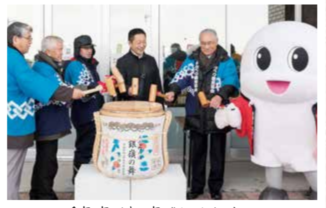
今年1年が良い年でありますように!