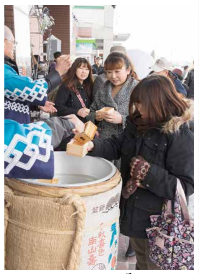
お正月ならではの振る舞い酒