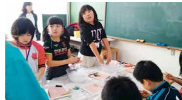
工作(まが玉づくり)