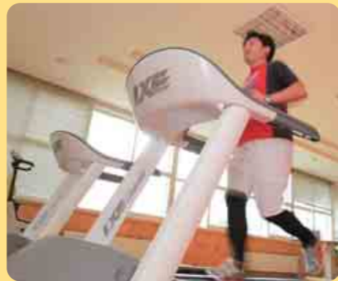
フロックスのランニングマシン (ゲートボールセンターでも利用できます)

「いやあね。これでだいぶ参加者が増えると思うよ」 全く根拠のない自信満々の話しぶりに思わず口元がゆるんでしまいます。そういえば、昨年のふきおろしマラソンにもサラリーマンの恰好をした風変わりなランナーがいたことを思い出し、はっとします。 「この人に違いない・・・」 東藻琴マラソンクラブは、30代から60代の男女で構成されたランニングを心から楽しむ爽やかなクラブです。各々の練習や大会の成績を互いに励まし合っ