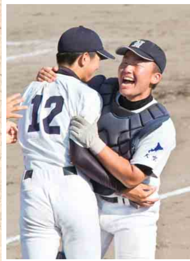
【決勝】 対 北見商業戦