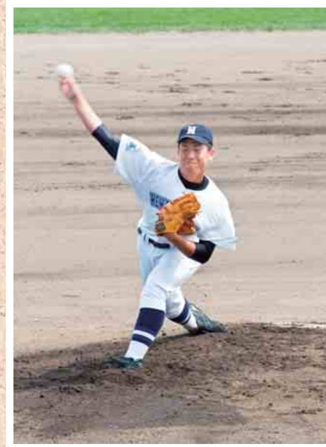
【1回戦】 対 網走桂陽戦