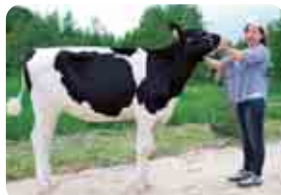
乳牛最高位 白馬照泰さん (ホワイトホースローヤルドパーク号)

6月14日(金)に女満別中央の家畜共進会場で大空町女満別総合家畜品評会が開催されました。見事受賞した3頭の乳和牛を紹介します。