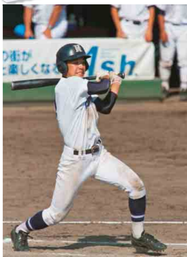
全道北北海道大会【1回戦】 対 帯広柏葉戦