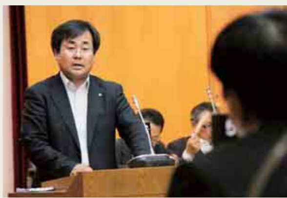
議論を交わす議員と町長

議会は平日の昼間に開催されているので仕事を持っている町民にとっては、傍聴に行く機会が少ないのが現状です。そのため、議会では、審議概要を議会広報でお知らせし、議事録をHPや図書館で閲覧できるようにしています。また、今年の3月からはインターネット中継を実施し録画も見る事ができます。このように議会で論議されている内容は、私たち町民の福祉向上のため行われています。しかし、現実として主人公たる私たち町民の関心が低い事実は否めないのではないのでしょうか。