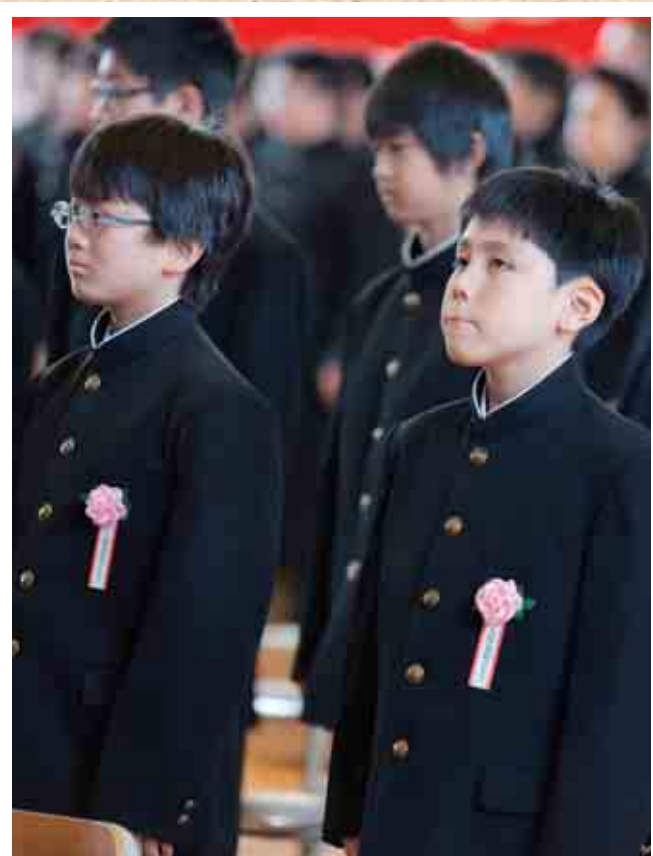
女満別中学校入学式