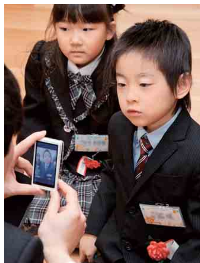
女満別小学校入学式