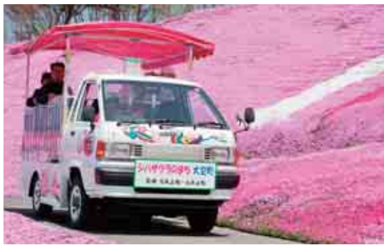
高台までゆっくり登る、園内遊覧車