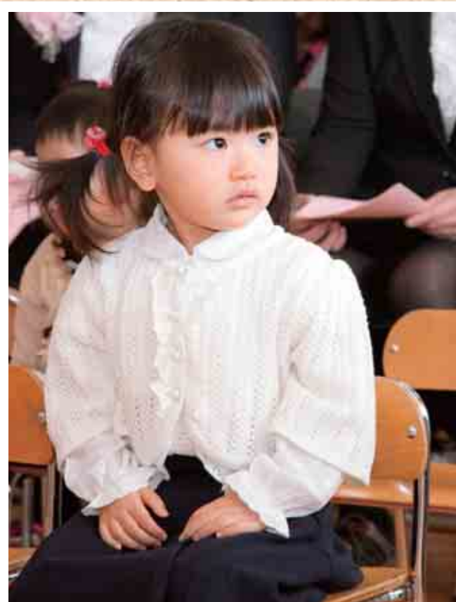
豊住保育園入園式