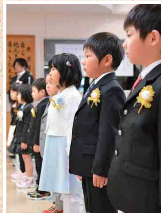
豊住小学校入学式