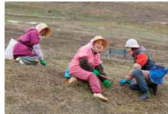
手作業で、丁寧に雑草を抜いていきます。

芝桜公園の芝桜たちは、スタッフの愛情によって毎年きれいな花を咲かせます。雪解けの時期から始まる仕事は、10ヘクタールの広大な急斜面を重い肥料散布機を背中に登ったり下ったり。そしてしつこいスギナをひと掴みずつ手作業で抜くといった、とても気の遠くなるような作業です。開花後の観光シーズンは、施設整備や清掃作業を行うため、姿はなかなか見