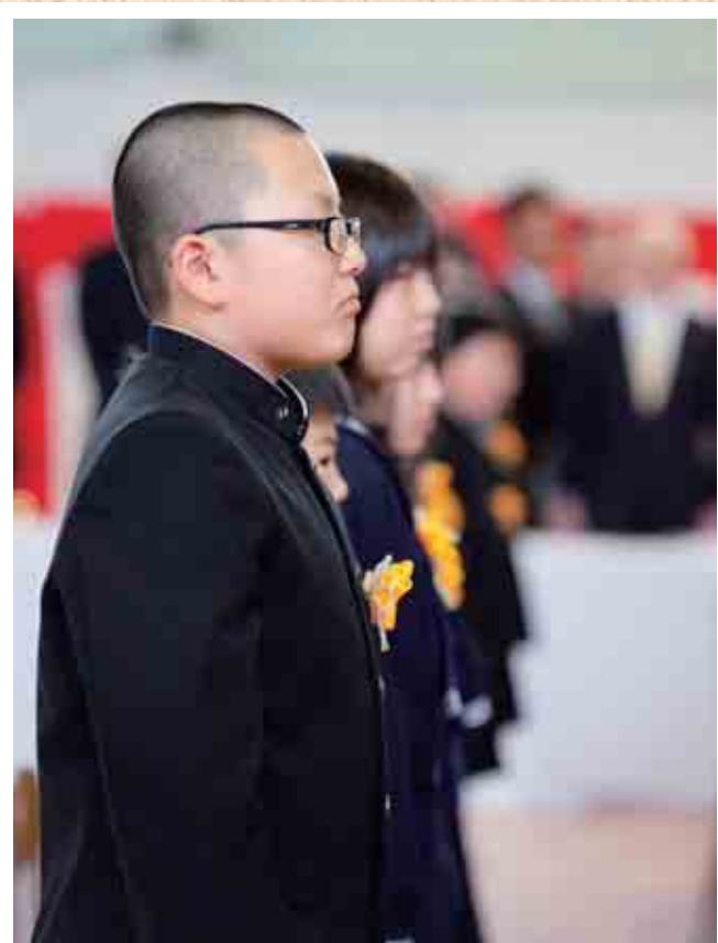
東藻琴中学校入学式