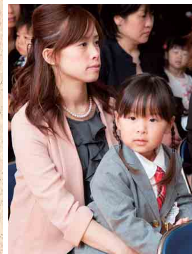
東藻琴幼稚園入園式