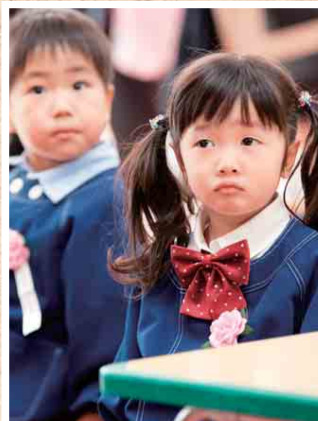
女満別幼稚園入園式