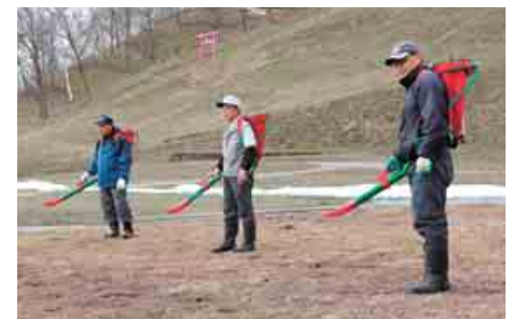
補植・肥料散布を行います。

芝桜公園の芝桜たちは、スタッフの愛情によって毎年きれいな花を咲かせます。雪解けの時期から始まる仕事は、10ヘクタールの広大な急斜面を重い肥料散布機を背中に登ったり下ったり。そしてしつこいスギナをひと掴みずつ手作業で抜くといった、とても気の遠くなるような作業です。開花後の観光シーズンは、施設整備や清掃作業を行うため、姿はなかなか見