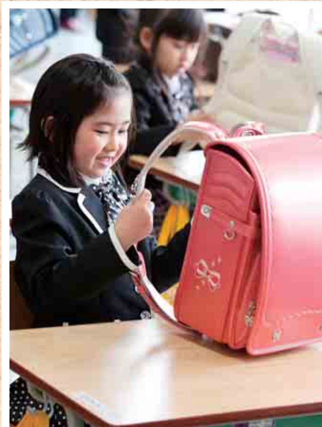
東藻琴小学校入学式