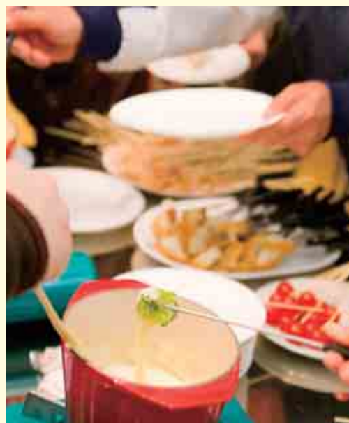
おいしいチーズフォンデュをいただきました。