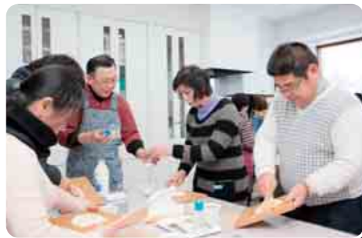
見て・食べて・体験できる チーズ施設