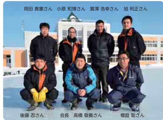
オープン当日に集まった実行委員会メンバー

平成23年度からは、運動公園から女満別小学校に場所を移動しました。先生方のご理解で、休み時間や少年団での活用もあり、利用者数も大きく増加しました。小舎には、貸出用のスケート靴もありますので、初心者でも利用できます。東藻琴地域の方も大歓迎です。親子で、冬のスポーツを楽しんでください。