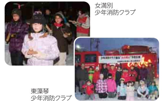
女満別 少年消防クラブ

クラブ員は寒い中、拍子木を打ち鳴らしながら「火の用心」と大きな声で各市街地を練り歩き、明るいお正月を迎えることができました。