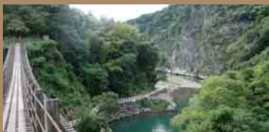
立神峡公園 (たてがみきょうこうえん)

立神峡という高さ87m、幅250mの絶壁に挟まれた峡谷にある公園。絶壁の上にある遊歩道を結ぶ2つの吊橋は、スリル満点です。夏季は避暑地として利用され、水遊びや魚釣りなど終日賑わいを見せています。天気の良い日はハイキングコースとして親しまれています。