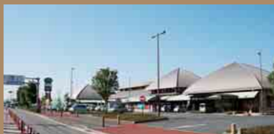
道の駅 竜北 (りゅうほく)

立神峡という高さ87m、幅250mの絶壁に挟まれた峡谷にある公園。絶壁の上にある遊歩道を結ぶ2つの吊橋は、スリル満点です。夏季は避暑地として利用され、水遊びや魚釣りなど終日賑わいを見せています。天気の良い日はハイキングコースとして親しまれています。