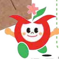
© 2009 town HIKAWA 氷川町PRキャラクター ひかりん

平成14年に「東藻琴村」と「宮原町」が友好町村の提携を行い、10年が経過しました。今年、10周年を記念して、氷川町交流団の皆様が、8月26日に「フンキョーランドふるさとまつり」へ参加し、特産品の販売を行いました。町からは、来年3月30日、31日に「氷川まつり」へ参加を予定し、特産品の販売を行う予定です。