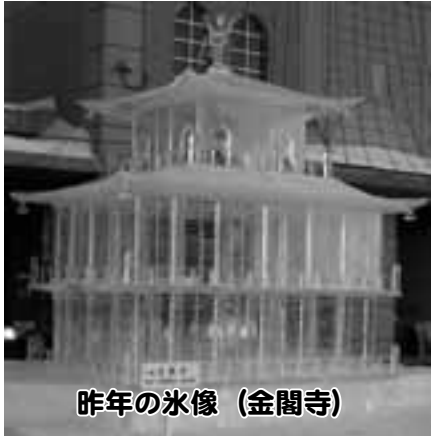
昨年の氷像(金閣寺)

季 節を問わず多くの客が訪れる道の駅で、今年も大空町の冬を満喫できるイベント「道の駅冬まつり」が開催されます。