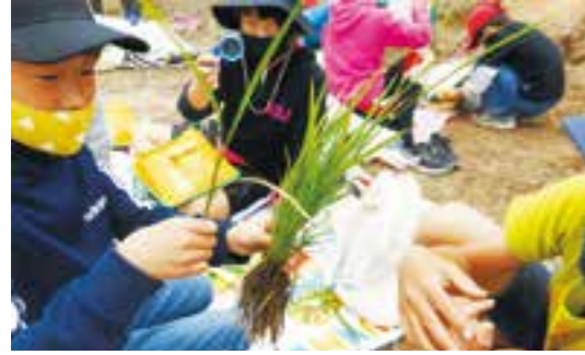
7月8日(木) 観察会 稲が健やかに成長している様子を観察