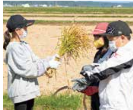
9月16日(木) 稲刈り 鎌で稲刈りを体験! 上手に刈取りできました