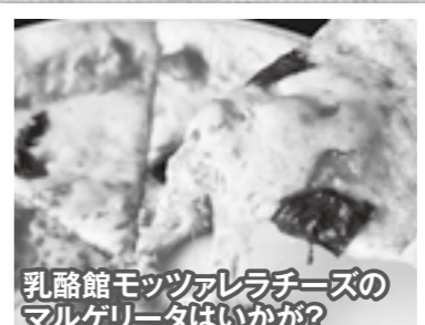
乳酪館モッツァレラチーズのマルゲリータはいかが？

地元野菜や乳酪館のチーズをたっぷり使ったピッツァ、網走湖産しじみのパスタ、さくら豚の串カツミートパスタなど、大空町ならではのオリジナルメニューが豊富。木曜日限定で提供されるカレーやうな丼（7月~8月）もオススメ。