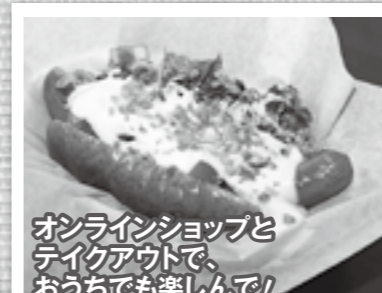
オンラインショップとテイクアウトで、おうちでも楽しんで！

「町内でも自分の住んでいない地区の飲食店を知らない…」 「行ってみたいけどなかなか利用しづらい…」 という町民みなさんからの声を受け、町内の飲食店を紹介します。コロナ禍で奮闘する飲食店を町民みなさんで応援しましょう！テイクアウト割引も実施中です。