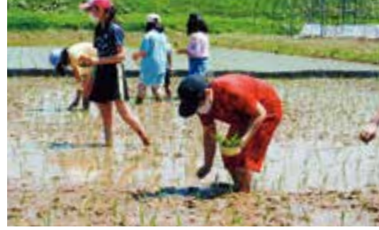
5月20日(木) 田植え 裸足で田んぼに! まっすぐ植えられたかな?