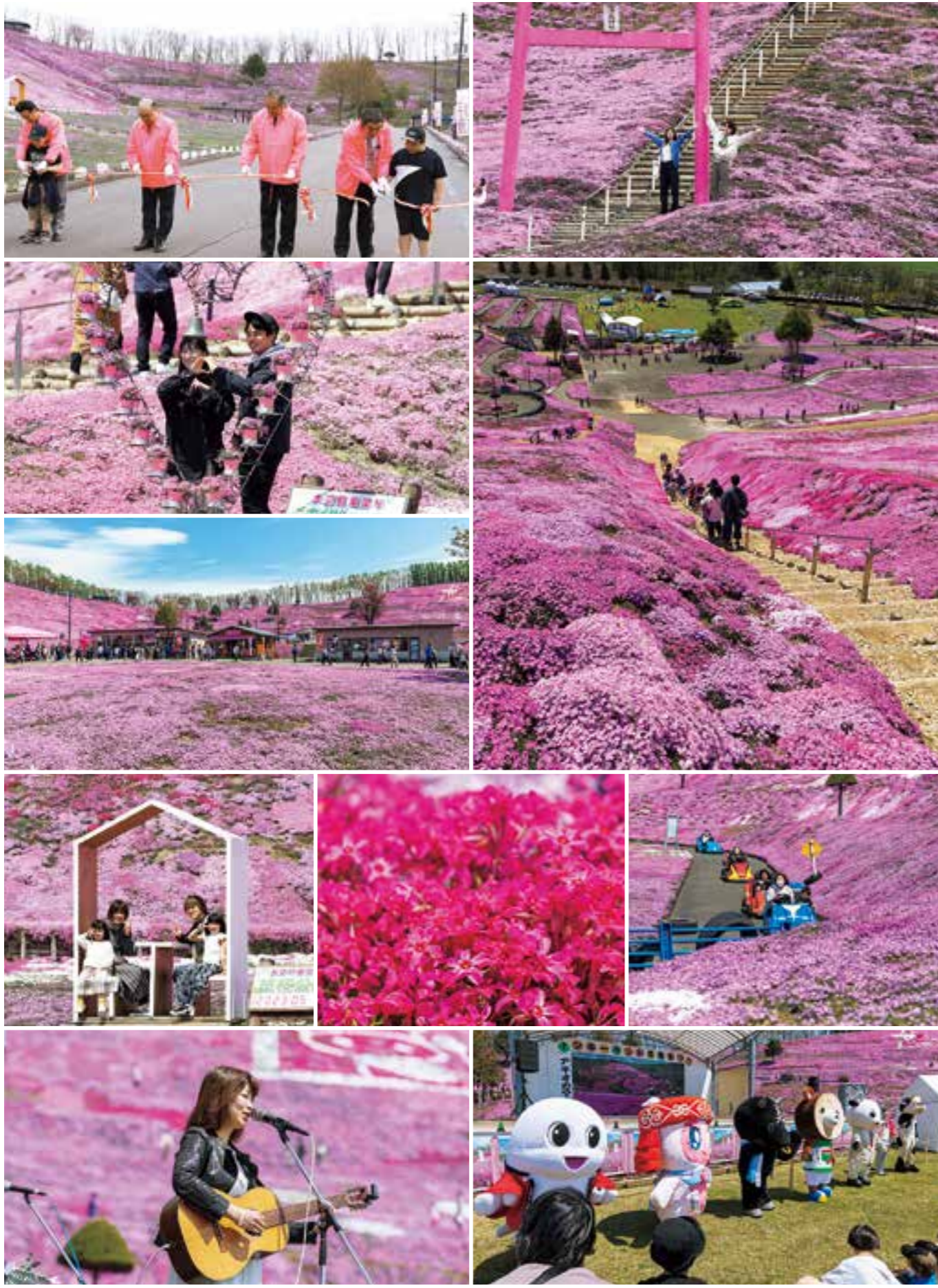
※こちらは、おぼろげに撮影されています

5月3日から31日まで開催された「芝桜まつり」。昨年までの干ばつなどの影響により、残念ながら満開宣言は出せませんが、天候に恵まれたこともあり、ピロードの絨毯のように芝桜がとてもきれいに咲きました。その様子を写真でお届けします。