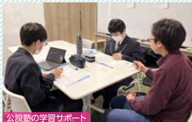
公設塾の学習サポート