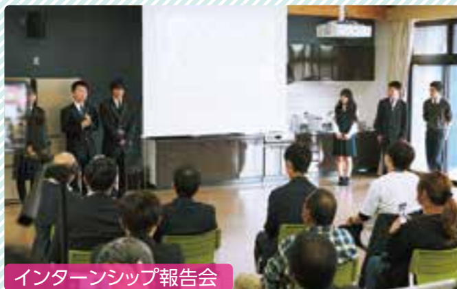
インターンシップ報告会

地域住民の方にインターンシップ報告会を実施。高校の取組みに理解を深めてもらいました。