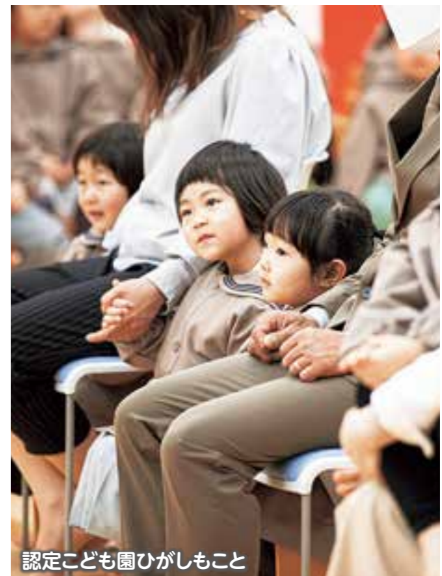
認定子ども園ひがしもこと