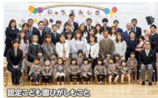
認定子ども園ひがしもこと