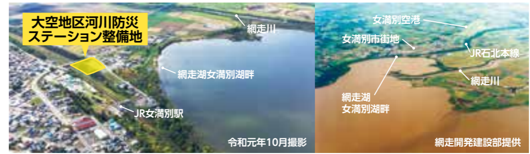
▲空から見た女満別湖畔 ▲平成13年9月洪水時の網走湖の状況

河川防災ステーション整備期間中(令和5~6年度)には、平常時の施設利用や運営のあり方のほか、女満別湖畔を中心とした周辺の観光資源などと連携した、活発な施設活用を検討していきます。