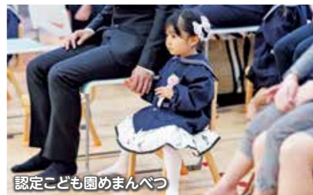
認定子ども園めまんべつ