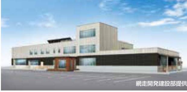
▲水防センター施設外観イメージ