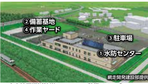
▲大空地区河川防災ステーション整備イメージ 実際の整備完了時と異なる場合があります。

また平常時に水防センターは地域活動拠点として、自治会活動・観光・福祉・地域防災教育の場として、町民みなさんに身近で気軽に利用していただける施設となるよう整備します。