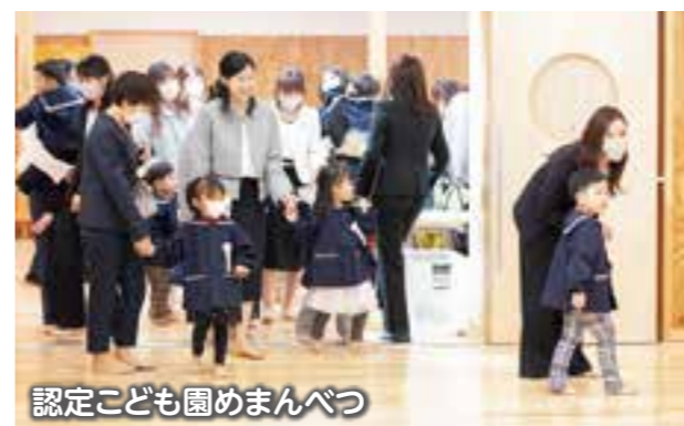
認定子ども園めまんべつ