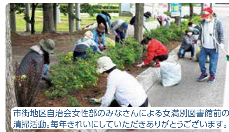
市街地区自治会女性部のみなさんによる女満別図書館前の清掃活動。毎年きれいにさせていただきありがとうございます。