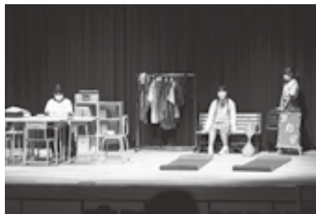
昨年の演劇祭の様子

オホーツク管内の高校生による演劇フェスティバル！令和4年度は5作品を上演予定。1作品あたり1時間なので気軽に観劇いただけます。高校生の私生活にまつわる等身大の作品から社会的課題などをテーマにした作品など多彩な作品を上演します。