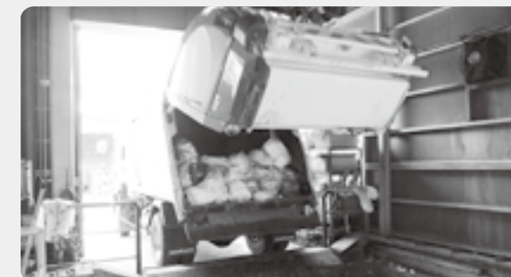
一般廃棄物焼却処理施設に集められたごみは、有害物質が出ないよう安全に焼却処理をしています。