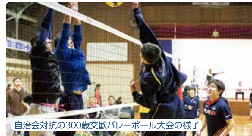
自治会対抗の300歳交歓バレーボール大会の様子

自治会活動とは、同じ地域にお住まいのみなさんが交流を通じて親睦と連帯感を深め、地域のさまざまな問題を協力して解決するなど、住みよい豊かなまちづくりを進めるため、自主的に活動している住民の自治組織です。大空町には現在48の自治会があり、多くの世帯が加入しています。今月号では改めて「自治会活動」とは何かということにスポットを当ててお伝えします。「加入したいけれど、加入の仕方がわからない」という方は、ぜひお問合せください。