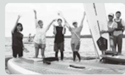
問 役 移住・定住支援室(内線342)

7月31日、網走湖女満別湖畔にて「SUPLAND IN OZORA2022」というSUP(スタンドアップパドル)を楽しむイベントが開催されました！話題となっているサップヨガやサップドックなど、さまざまな楽しみ方ができる盛りだくさんな1日でした！上司からの勧めで昨年からSUPを始めたのですが、網走湖で大規模なイベントが開催されることは今までなかったのでも嬉しかったです！役場の友人と一緒に体験会に参加しました。初めての方ばかりでしたが、楽しんでくれたので良かったです。キッチンカーの出店もあり、お腹も十分に満たされました！