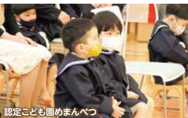
認定こども園めまんべつ