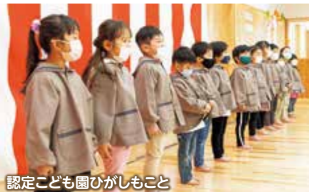
認定こども園ひがしもこと