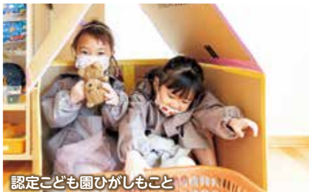
認定こども園ひがしもこと