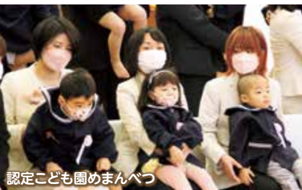
認定こども園めまんべつ