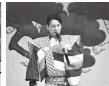
▲イリュージョン・サイエンスショー ▲和泉元彌狂言鑑賞会