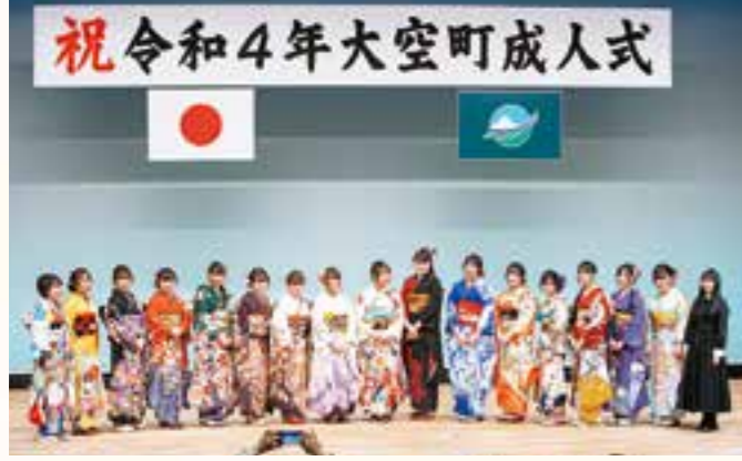
※写真を撮影する際は、新成人のみなさんにマスクを外していただきました。ご協力ありがとうございました。