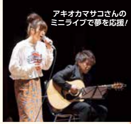
アキオカマサコさんのミニライブで夢を応援!