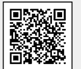
厚生労働省 ホームページ

追加接種で使用するワクチンに「モデルナ社製」が追加され、集団接種で使用されます。2回目までと異なるワクチンを接種した場合の安全性と効果は、国で許容されています。モデルナ社製ワクチンの詳細な情報は、厚生労働省のホームページで確認してください。