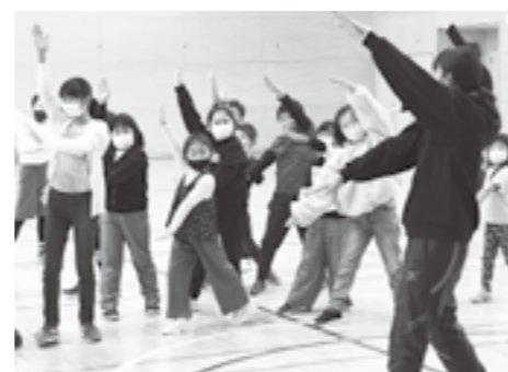
▲女満別小学校の科学教室 ▲東藻琴小学校のなかまづくり教室