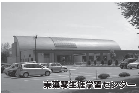
東藻琴生涯学習センター