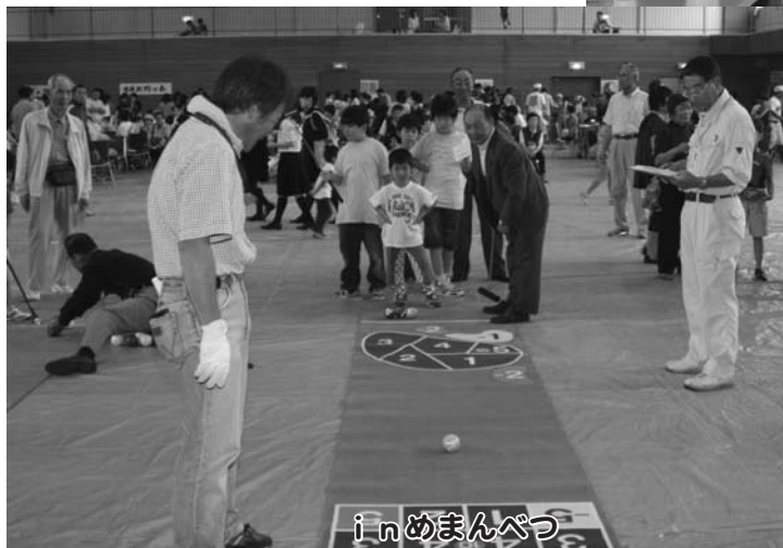
i n めまんべつ

会場では、車いす体験や右片マヒ疑似体験などの体験コーナー、レクリエーションなど様々な福祉イベントが行われ、子どもからお年寄り、障がいのある方との交流が深まりました。