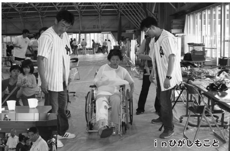
i n ひがしもこと

8月30日（土）は、女満別ゲートボールセンターで、9月7日（日）は、すぱーく東藻琴を会場にふれあい広場が開催されました。