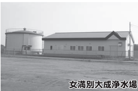
女満別大成浄水場

台所、トイレ、洗面所、風呂などの水回りの状況はいかがですか。屋外散水栓の閉め忘れはありませんか。蛇口、給水管等の点検、交換、修理に皆さんのご理解とご協力をお願いします。