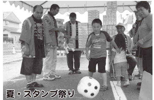
夏・スタンプ祭り