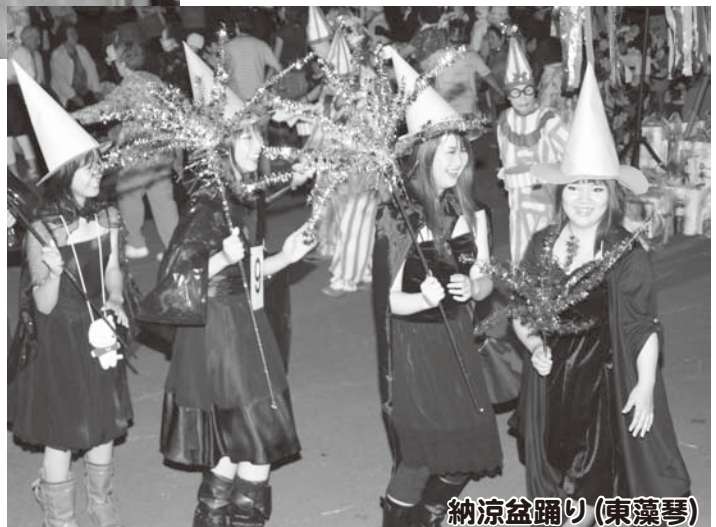
納涼盆踊り(東藻琴)