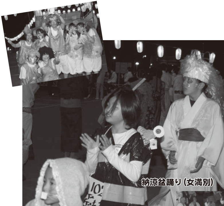
納涼盆踊り(女満別)