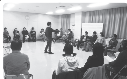
参加者一同、稽古に励んでいます。