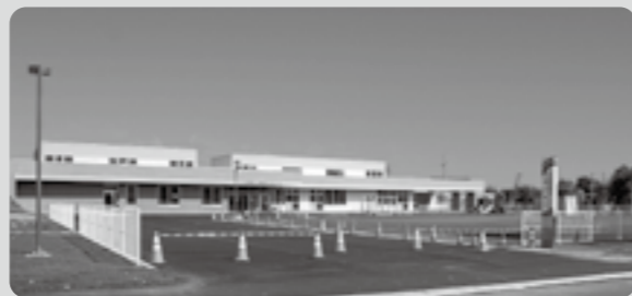
認定こども園ひがしもこと