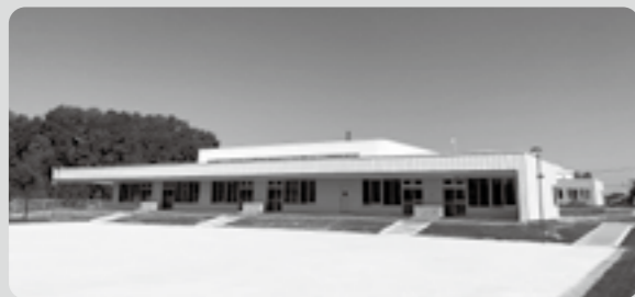
認定こども園めまんべつ