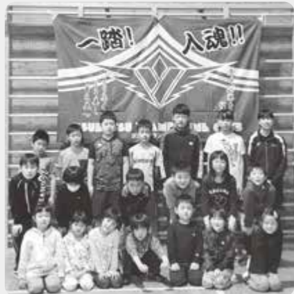
津別町トランポリンクラブのみなさん

「7月に福島県で開催される『第7回全日本トランポリン競技ジュニア大会』に向けて練習をしたいのですが、緊急事態宣言により、津別の施設が使えず、練習できない状態が続いています。もし、昨年のように大会が中止に...と考えることもありますが、大会への気持ちを切らさず、今できることを全てやって全国大会では決勝に進めるよう頑張りたいです」と抱負を話してくれました!