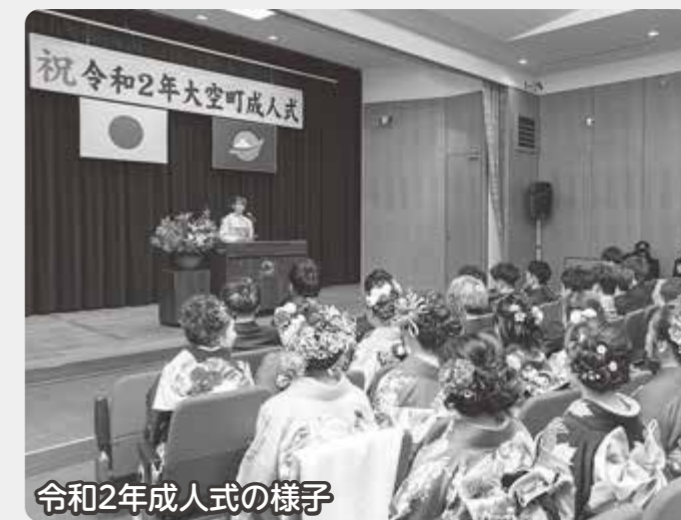
令和2年成人式の様子