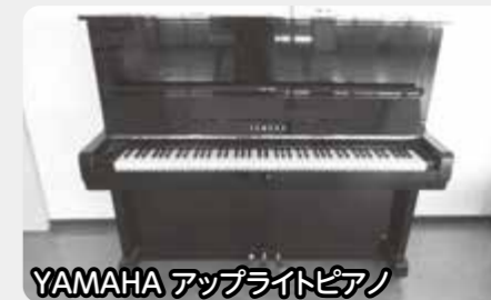
YAMAHA アップライトピアノ