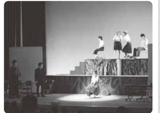
昨年の高校演劇祭の様子

上演スケジュールは9月下旬ごろから育成協ホームページでご覧頂けます。 育成協ホームページはこちら