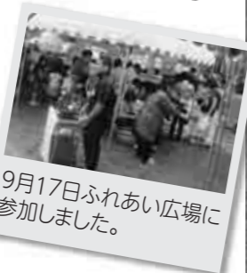
9月17日ふれあい広場に参加しました。

秋季北見支部大会では2回戦を勝利しましたが準決勝で敗退いたしました。来年に向けて頑張りますので変わらぬ応援をお願いします。また、大型ビニールハウスが完成しました。打、投、捕と有効に使わせて頂きます。選抜大会協賛金を充てさせていただきます。