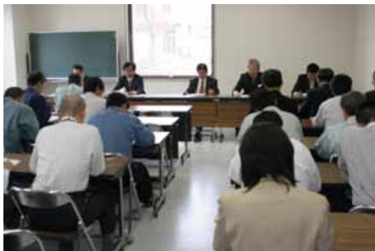
予算編成会議の様子

なお、参考までに各課から要求された一般会計の歳出の金額(図中①)は、約75億円となっています。歳出予算額が多ければいろいろな事業を行うことができますが、それを負担するた