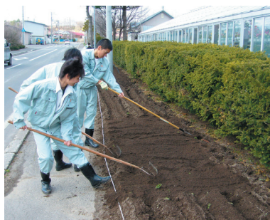
植える準備をする生徒たち