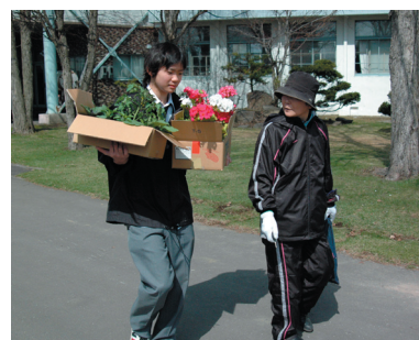
地域の方々との交流