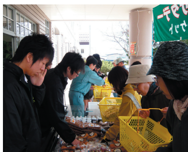
行列のできる肉製品販売