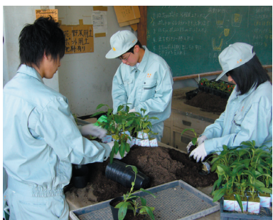
本校ならではの活動