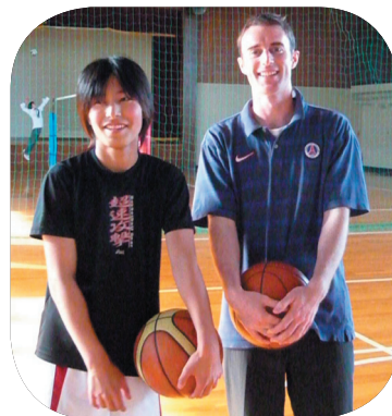
全国を目指すバスケットボール部

「流水腐らず」の言葉どおり、常に流れる水は淀むことなく腐らないように、東藻琴高校も現状にとどまることなく日々新しい発想で教育活動に邁進していきますので、本年度もよろしくご支援くださいますようお願い申し上げます。