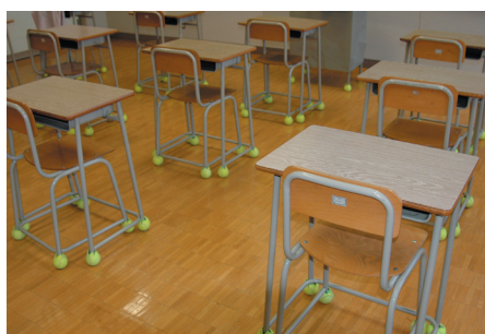
見た目もユニーク