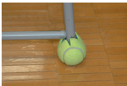
フェルトとゴムがクッション