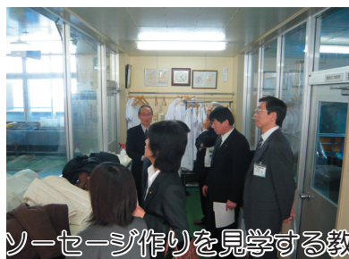
ソーセージ作りを見学する教育委員の方々

2月4日(水)、5名の教育委員が本校を訪れ、授業を参観するなどし、本校の教育活動を理解していただきました。