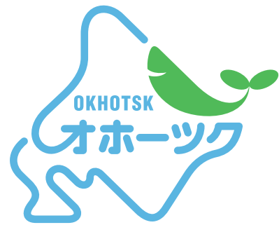
オホーツク・ ロゴマーク