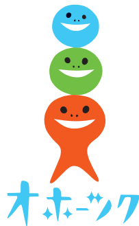
つくつく オホーツクん

オホーツク地域の企業、団体の方が使用する場合、使用した後に使用報告書を提出してください。