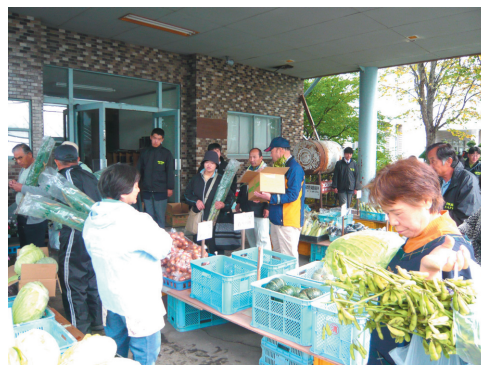
多くの方々が来校されました

チラシを見た地元の方々や北見から来られた方もおり、さらにマーケットの質を高めていきたいと思えます。