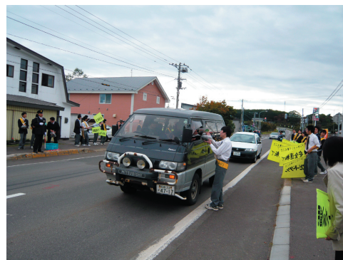
野菜を手渡し、交通安全を呼びかける

終了後は、日頃お世話になっている地域のために、町内清掃のボランティア活動を実施しました。