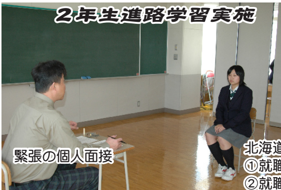
2年生進路学習実施