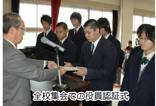
全校集会での役員認証式