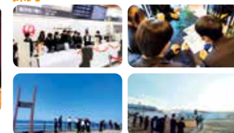
地域の問題を「発見」し「解決」する