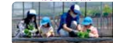
高校生とカボチャの苗植え