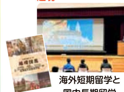
海外短期留学と 国内長期留学