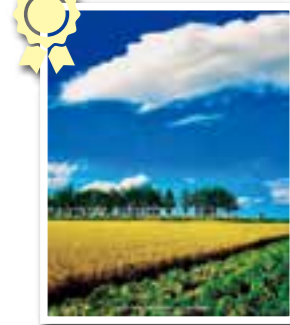
wheat field under blue sky with white clouds 札幌市 @moonsnowice さんの作品

トマップ川公園、毎年訪れています。秋は黄葉になる楓並木がとてもキレイで元気がもらえます。