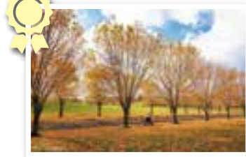
晩秋のトマップ川公園 遠軽町 batako339 さんの作品

この日、メルヘンの丘で見た夕焼けは本当に綺麗な景色でした。ここへ訪れたのは2回目。空の色も前とはまた違って、素敵な風景が目の前に広がっていました。四季折々いろいろな季節で訪れたい場所です。