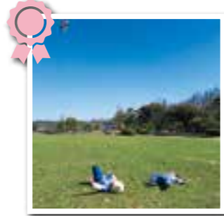
カイト、大空に舞う 長崎県 みどりさんの作品