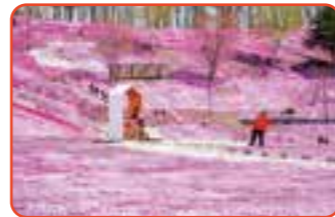
第39回芝桜まつり開催