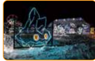
コンコンロン冬のおおぞらイルミネーション

©2023Pokémon.©1995-2023 Nintendo/Creatures Inc./GAME FREAK inc. ポケットモンスター・ポケモン・Pokémonは任天堂・クリーチャーズ・ゲームフリークの登録商標です。