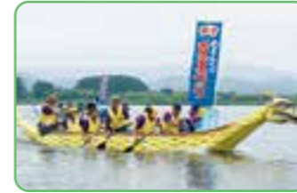
ドラゴンボート競技会