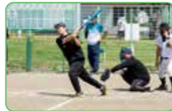
町民交歓ソフトボール大会