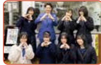
鈴木直道知事が来校