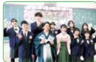
女満別キャンパス最後の卒業式

©2023Pokémon.©1995-2023 Nintendo/Creatures Inc./GAME FREAK inc. ポケットモンスター・ポケモン・Pokémonは任天堂・クリーチャーズ・ゲームフリークの登録商標です。