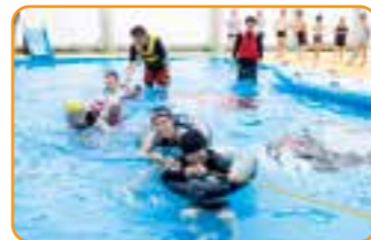
東藻琴のプールがリニューアル