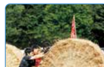
ロール転がしどってん酷