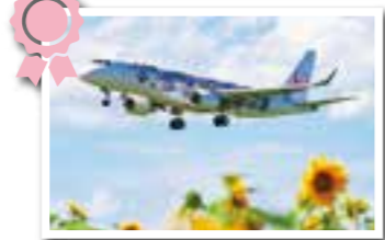
いざタッチダウン 北見市 井上 栄さんの作品

夏休みに、楽しみにしていた旅行で撮影しました。公園の遊具で遊んでいるともくもく雲を娘達が発見!!「青空と雲が綺麗だね」と旅行の素敵な思い出の一つになりました(^^)