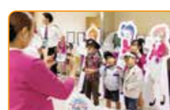
女満別空港スカイフェスティバル