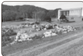
仮置場(平成30年胆振東部地震:穂別スポーツセンター)