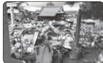
公園などに混合状態堆積(令和元年 東日本台風(台風19号):栃木県佐野市)