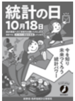
令和6年度「統計の日」ポスター 令和6年度の特選作品が活用されています。

品、全体で特選を1作品決定し、表彰状および副賞が授与されます。 （令和7年6月発表）