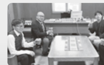
町長・副町長と住吉作業所で収穫したハスカップを使用したラッシーを飲んでいただきました