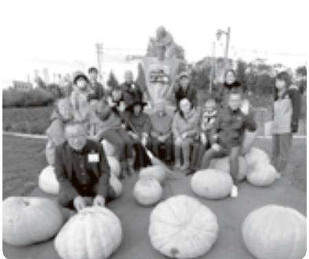
過去に開催した まち巡りツアーの様子