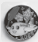
大空高校生デザイン