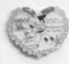
大空町20年記念デザイン

大空町共同募金委員会では、大空高校生や大空町誕生20年を記念したデザインのピンバッジを作成し、500円以上の募金をしていただいた方にお渡ししています。製作費などを除く金額が募金となり、集まった募金は大空町でさまざまな活動を行なっている団体などへ配分し、その活動を支援しています。ピンバッジをご希望の方は両地区の社会福祉協議会、道の駅での募金をお願いします。