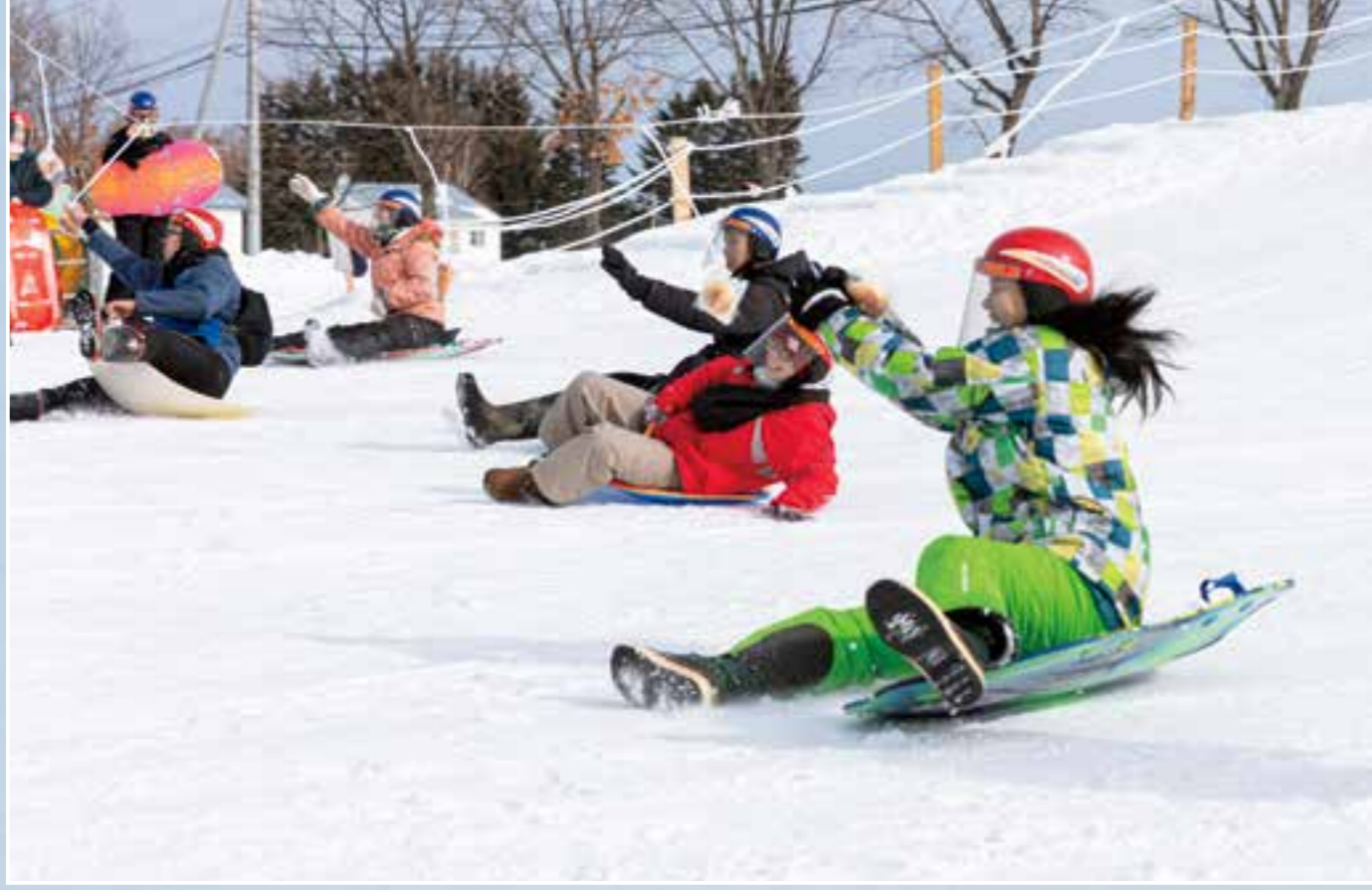
2月2日(日)、道の駅メルヘンの丘めまんべつにて、冬まつりが開催されました。そりすべり台パン食い大会や雪中モルック大会をはじめ、さまざまな催しが行われ、参加した方々はだいに盛り上がっていました。また、会場にはキッチンカーの出店や姉妹都市氷川町の物販もあり、グルメも楽しめるイベントとなりました。