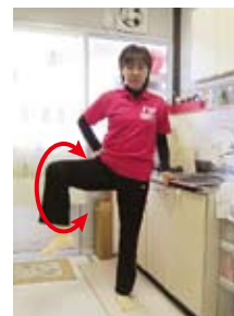
股関節のほぐし(膝を伸ばして・膝を曲げて・内回し外回し)