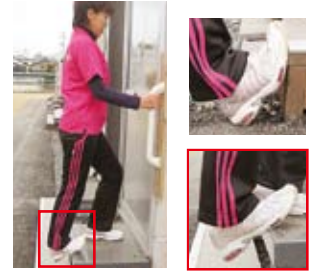
アキレス腱伸ばし