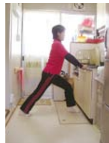
ふくらはぎ伸ばし