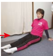
足首の曲げ伸ばし