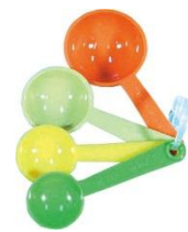
減塩指導スプーン