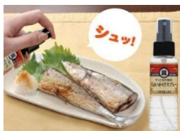
ちよいかけスプレー