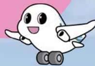
大空町観光大使 そらつきー