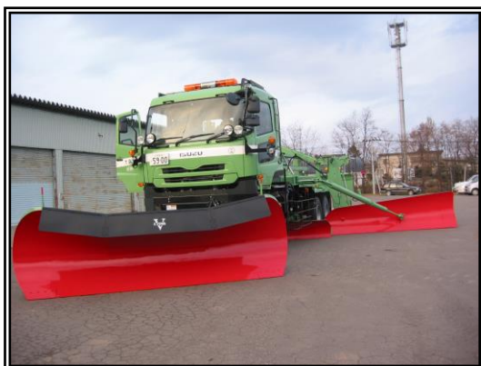
【除雪トラック専用車】