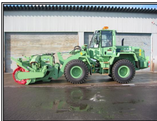
【ロータリ装置脱着式】